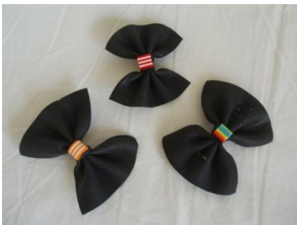
Sløjfe-brocher – kr. 25