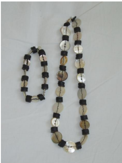
Armbånd og halskæde m. perlemorsknapper Armbånd 95,- Halskæde 145,-