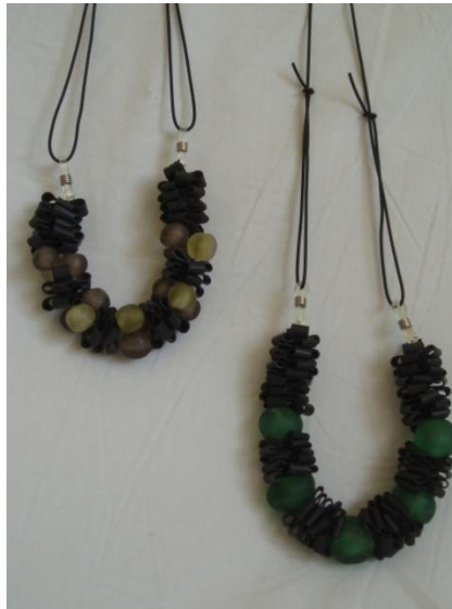
Halskæder m. ghanesiske glasperler Kr. 145,-