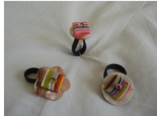
Fingerringe m. perlemor og plast Kr. 95,-