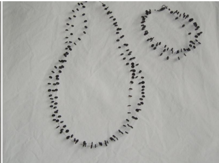
"Pletter i luften" (små) Armbånd 95,- Halskæde 145,-