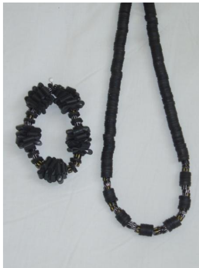
Armbånd og halskæde m. antikke afrikanske perler Armbånd 145,- Halskæde 195,-