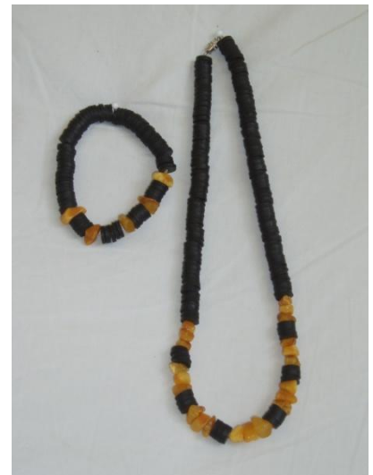
Armbånd og halskæde m. rav Armbånd 95,- Halskæde 145,-