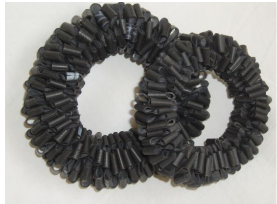
FEDE armbånd – kr. 95,-