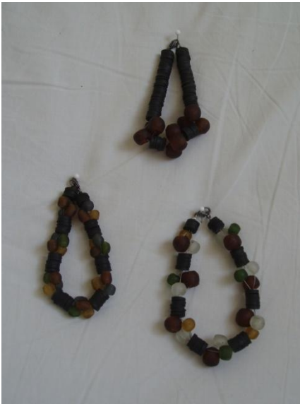
Armbånd m. ghanesiske glasperler Kr. 95,-