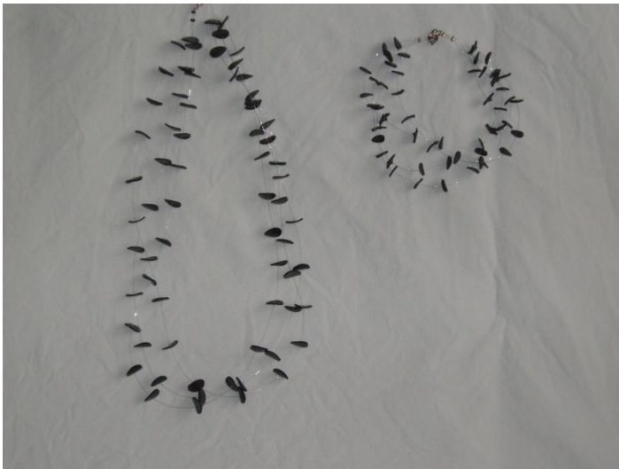
"Pletter i luften" (store) Armbånd 95,- Halskæde 145,-